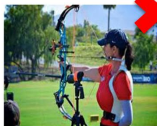
Interdit car Support du tronc

Pour les arcs Classiques aucun dispositif d'aide à la décoche n'est autorisé. Toutefois un para archer peut utiliser une "palette de bouche" à condition qu'elle soit attachée de façon permanente à la corde.