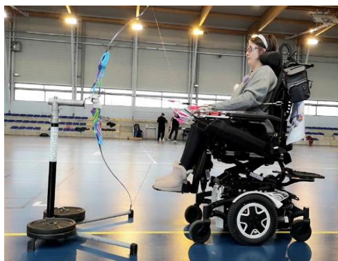
Fauteuil 6 roues