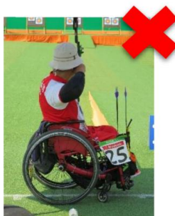
sert de support => non autorisé