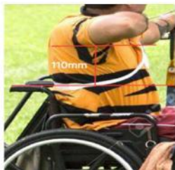
Mesure du point le plus haut du fauteuil

⇒ Si cette règle ne peut être respectée pour une raison médicale (en particulier pour les archers en catégorie W1), ce point devra faire l'objet d'un accord du classificateur et sera obligatoirement spécifié sur la carte de classification.