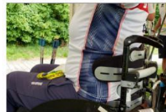
Support latéral spécifique

Concernant l'utilisation d'un repose bras sur le fauteuil : il est autorisé tant qu'il ne sert pas de support latéral (voir ci-dessous)