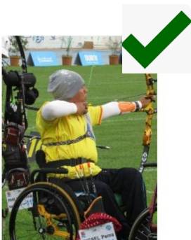
pas de support => OK

Concernant l'utilisation d'un repose bras sur le fauteuil : il est autorisé tant qu'il ne sert pas de support latéral (voir ci-dessous)