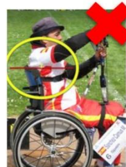
Hauteur non autorisée

h) Les poignées du fauteuil attachées aux montants du dossier sont considérées comme appartenant au fauteuil et doivent également être à une distance supérieure de 110mm de l'aisselle de l'archer. Sinon, elles doivent être retirées.