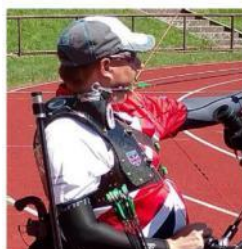
Aucun support du tronc