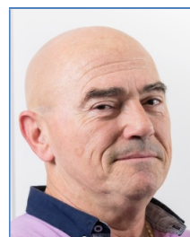
M. Daumas Com. Parcours Tir nature/3D