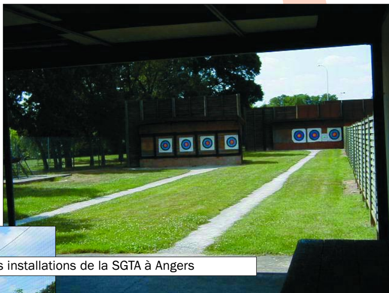
Les installations de la SGTA à Angers