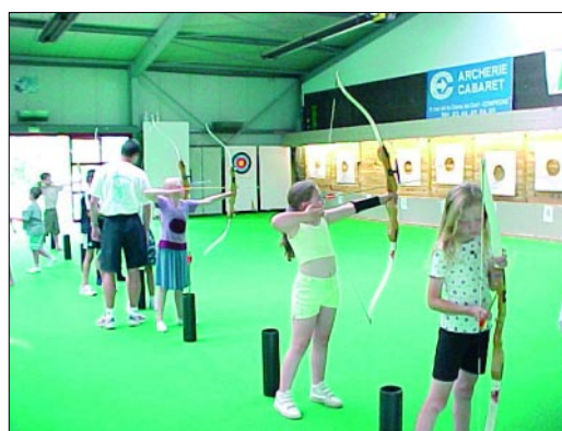
Le Centre Régional de Compiègne

La ciblirie est composée d'un mur de tir d'une largeur moyenne de 12 mètres, quelques cibles mobiles sont disponibles. 18% de clubs ne possèdent pas ces dernières.